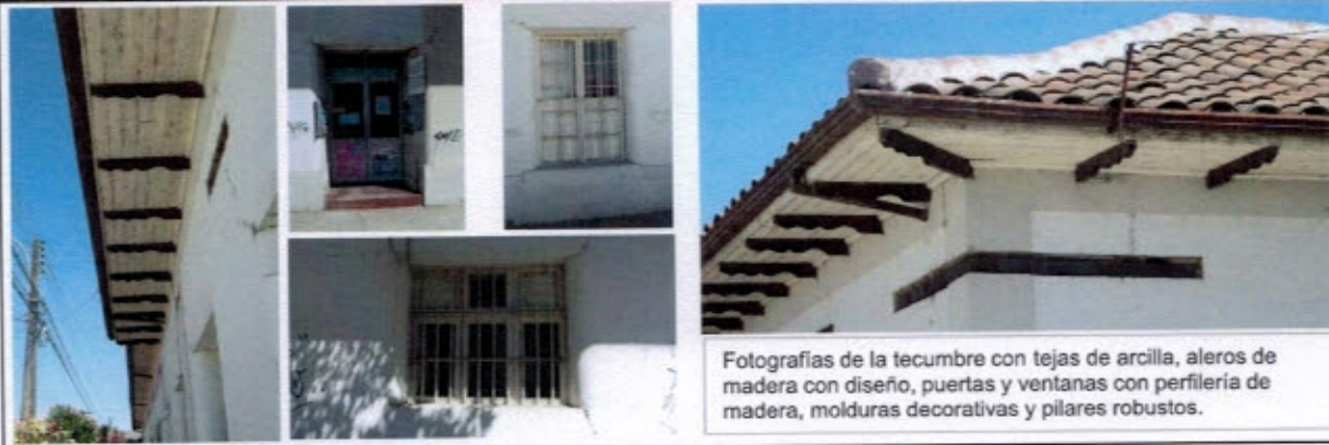
Fotografías de la techumbre con tejas de arcilla, aleros de madera con diseño, puertas y ventanas con periferia de madera, molduras decorativas y pilares robustos.