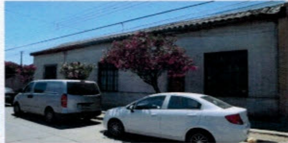
Fotografías de la tecumbre con tejas de arcilla, aleros cortos de madera, puertas y ventanas con perfilera de madera y molduras decorativas.