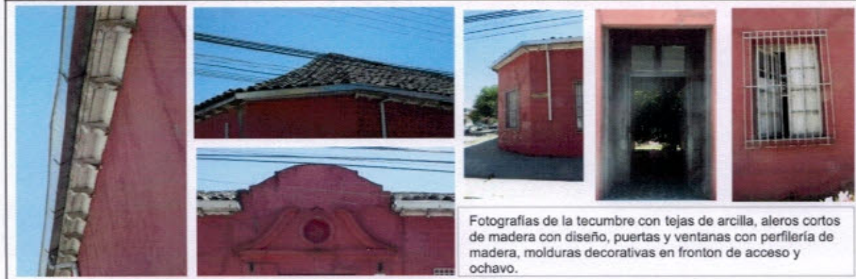
Fotografías de la techumbre con tejas de arcilla, aleros cortos de madera con diseño, puertas y ventanas con perfilera de madera, molduras decorativas en fronton de acceso y ochavo.