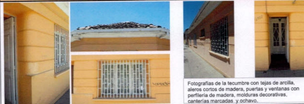
Fotografías de la tecumbre con tejas de arcilla, aleros cortos de madera, puertas y ventanas con perfilera de madera, molduras decorativas, canterías marcadas y ochavo.