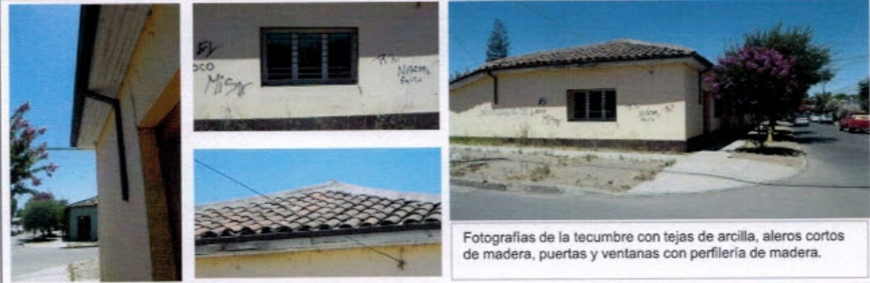
Fotografías de la tecumbre con tejas de arcilla, aleros cortos de madera, puertas y ventanas con perfilera de madera.