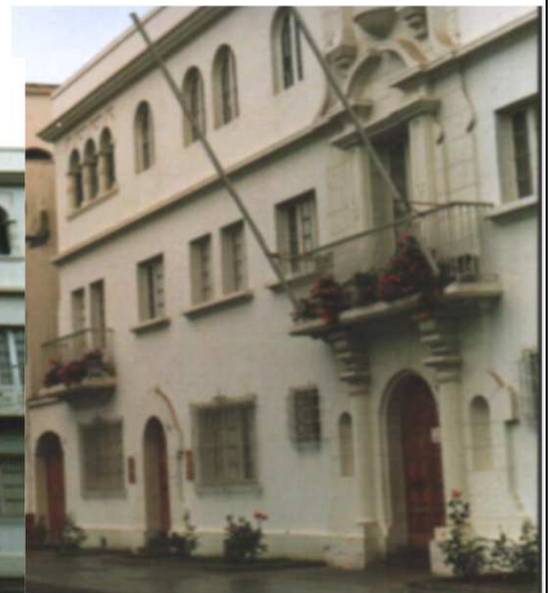
DETALLE DEL ACCESO