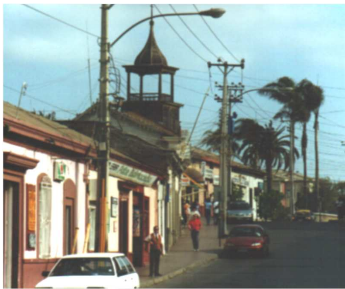
INSERCIÓN URBANA DE LA IGLESIA, VISTA DESDE EL ORIENTE