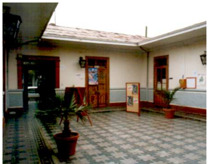
DETALLE DEL PATIO INTERIOR