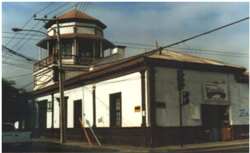
DETALLE DE LA ESQUINA DE BALMACEDA CON AMUNATEGUI