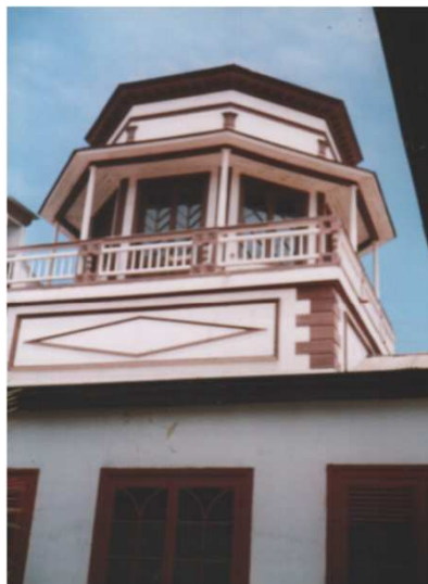
DETALLE DEL TORREON