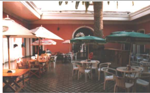
DETALLE DEL PATIO POSTERIOR