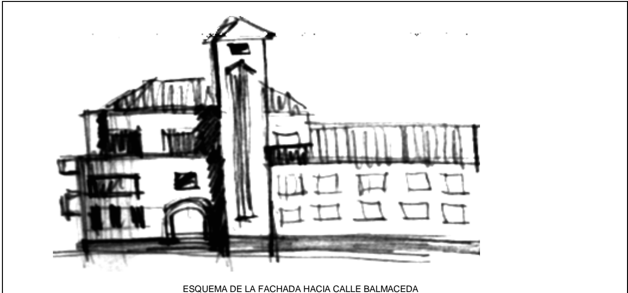
ESQUEMA DE LA FACHADA HACIA CALLE BALMACEDA