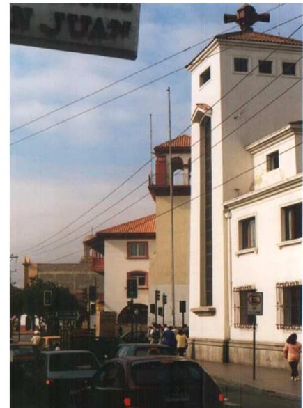
VISTA DESDE BALMACEDA