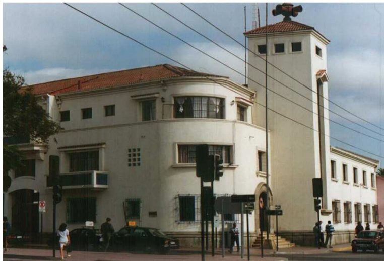
VISTA DESDE FCO. DE AGUIRRE CON BALMACEDA