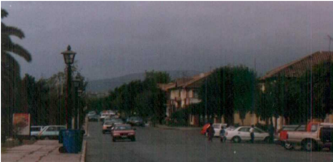
VISTA DESDE P.P. MUÑOZ