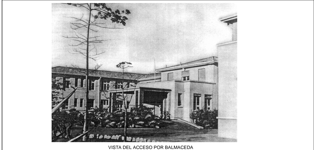
VISTA DEL ACCESO POR BALMACEDA