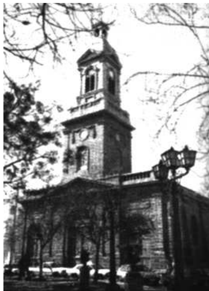
FACHADA DE LA IGLESIA CATEDRAL DE LA SERENA