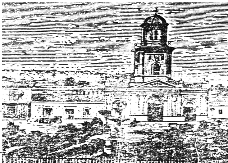
VISTA EN 1872