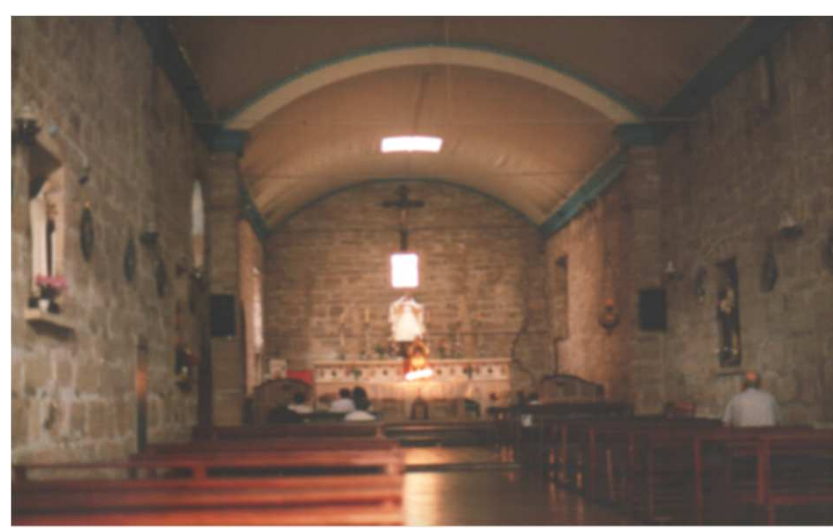
INTERIOR DE LA IGLESIA