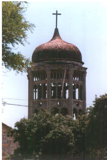
VISTA DEL TORREON