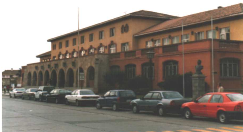
FACHADA A CALLE A. PRATT