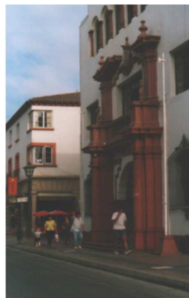
VISTA DESDE CALLE A. PRATT