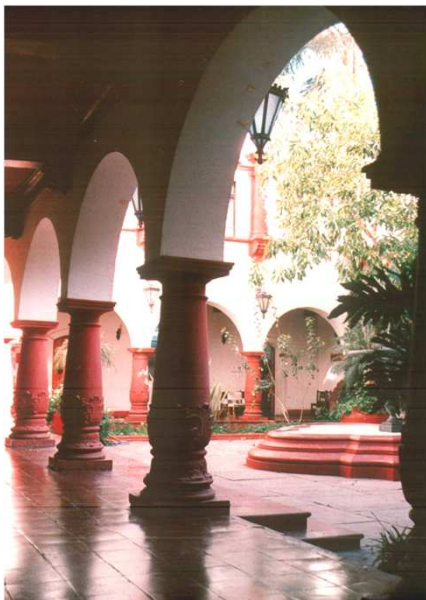
VISTA PATIO INTERIOR