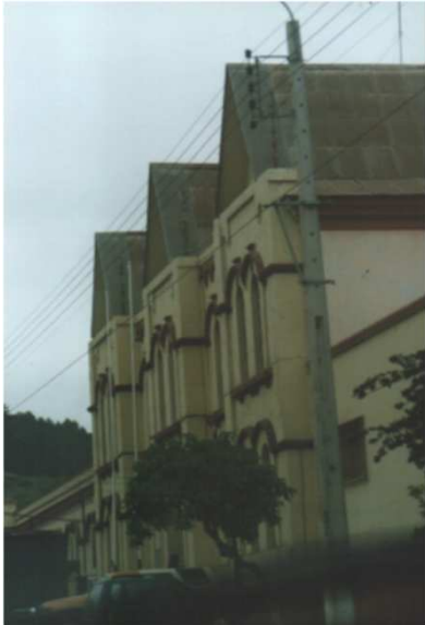
ACCESO PRINCIPAL MARCADO POR TRES NAVES DE DOS PISOS