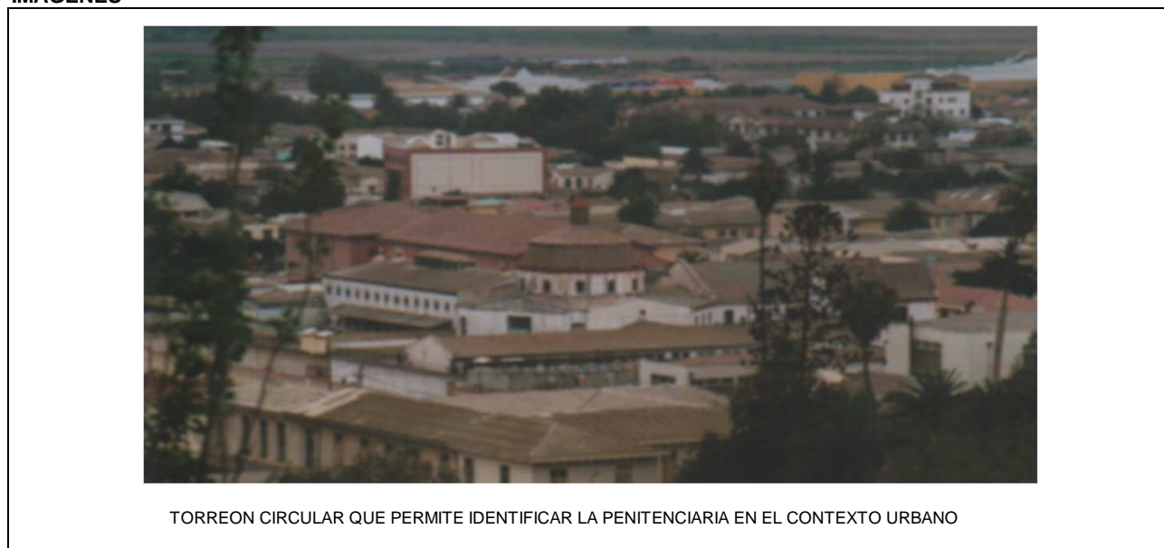
TORREON CIRCULAR QUE PERMITE IDENTIFICAR LA PENITENCIARIA EN EL CONTEXTO URBANO