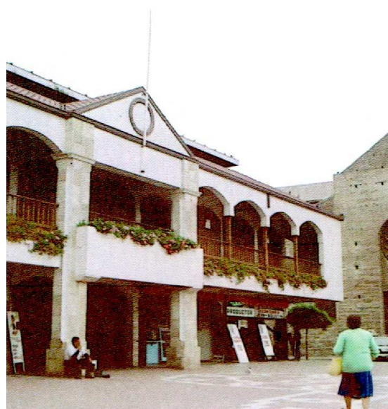
VISTA FACHADA PRINCIPAL