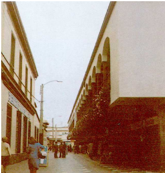
VISTA POR ZORRILLA