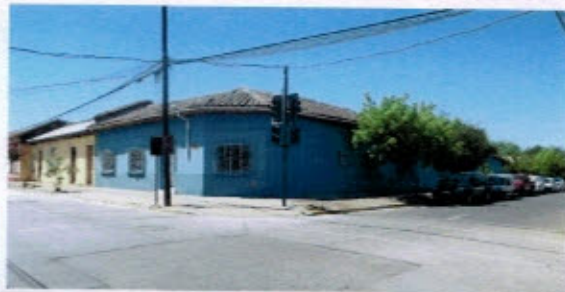
Fotografías de la tecumbre con tejas de arcilla, aleros cortos de madera, puertas y ventanas con perfilera de madera, molduras decorativas y ochavo.