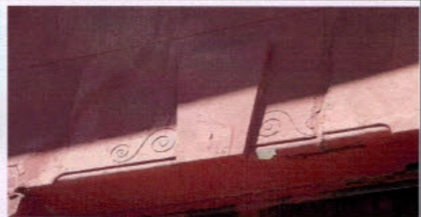
Fotografías de la tecumbre con tejas de arcilla, aleros cortos de madera, puertas y ventanas con perfilera de madera, molduras decorativas en frisos.