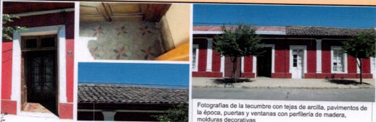
Fotografías de la tecumbre con tejas de arcilla, pavimentos de la época, puertas y ventanas con perfiles de madera, molduras decorativas