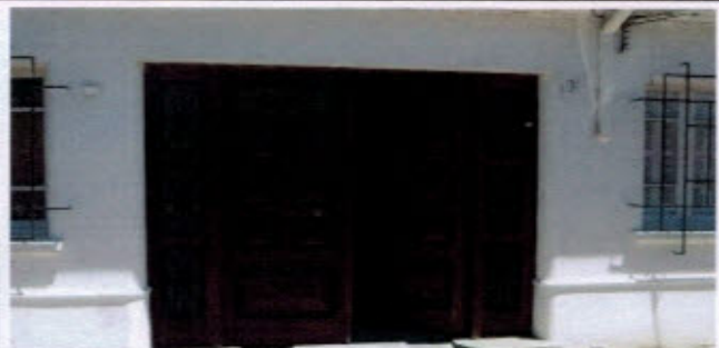
Fotografías de la techumbre con tejas de arcilla, aleros cortos de madera, puertas y ventanas con perfilera de madera, molduras decorativas y ochavo.