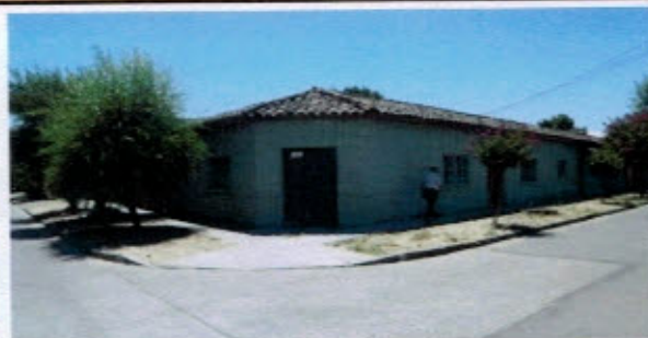
Fotografías de la tecumbre con tejas de arcilla, aleros cortos de madera, puertas y ventanas con perflería de madera, molduras decorativas y ochavo.