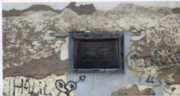
Fotografías de la tecumbre con tejas de arcilla, aleros cortos de madera, ventanas con arcos de medio punto y muros de adobe.