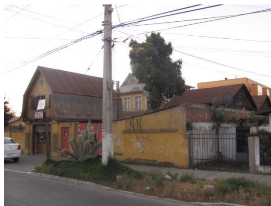
Imagen 21 Registro Consultora URBE, septiembre 2016