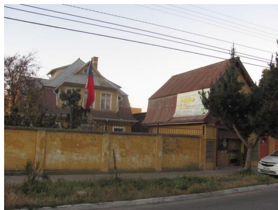
Imagen 22 Registro Consultora URBE, septiembre 2016