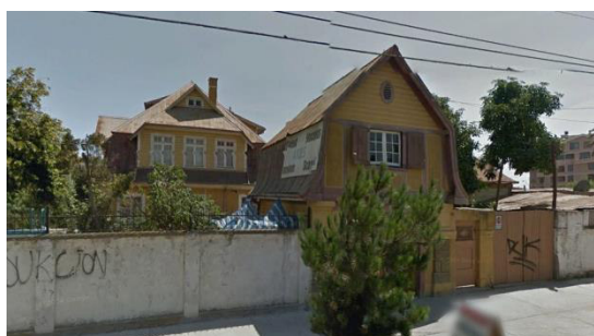
Imagen 23 (Departamento de Asesoría Urbana de Quilpué)