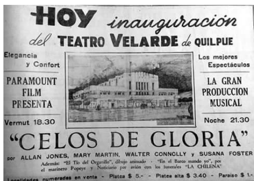
Imagen 46 Aviso publicado en el diario La Unión de Valparaíso el viernes 6 de mayo de 1940 (Brignardello, 2015, pág. 53)