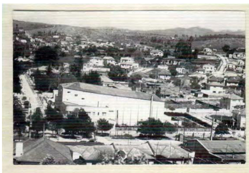
Imagen 48 Panorámica de Quilpué, 1959. (Alarcón & Calventus, 2009, pág. 104)