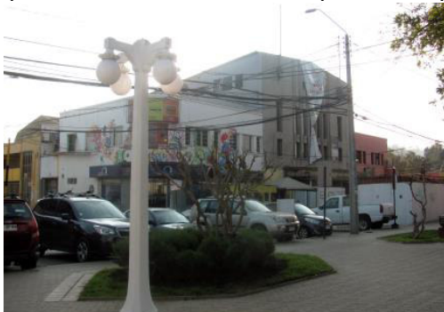
Imagen 51 Registro Consultora URBE, junio 2016