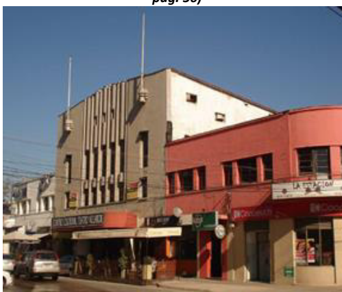
Imagen 50 Registro Asesoría Urbana de Quilpué (Departamento de Asesoría Urbana Municipalidad de Quilpué)