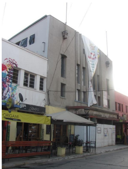
Imagen 47 Registro Consultora URBE, junio 2016