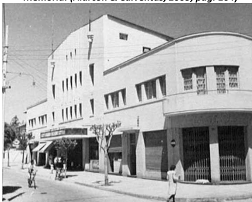
Imagen 49 Teatro Velarde década 1960 (Brignardello, 2015, pág. 56)