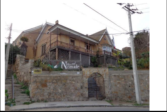
TABLA DE VALORACION PARA DEFINIR INMUEBLES DE CONSERVACIÓN HISTORICA

Altura Total del Edificio : 12 mts. aprox.